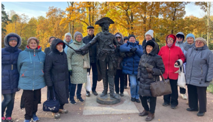
«Блистательные владельцы Ораниенбаума»