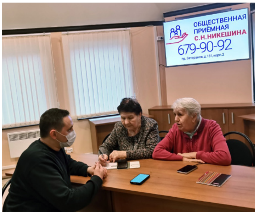
Занятие по изучению смартфона