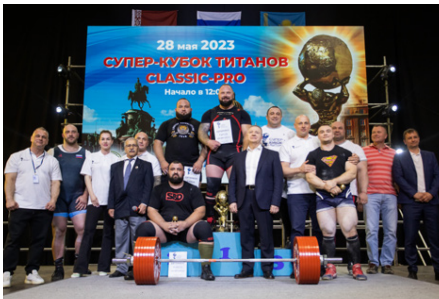
СУПЕР-КУБОК ТИТАНОВ CLASSIC-PRO 2023