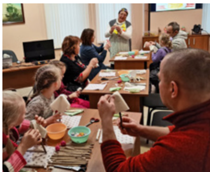
В процессе изготовления народной куклы