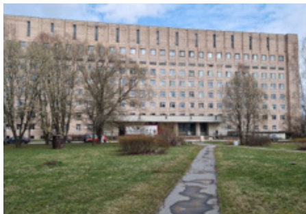
Городская больница № 15

■ Сотрудники Общественной приемной при содействии ООО «Фламинго», производящего медицинские изделия, передали медицинским и социальным учреждениям более 142 000 комплектов абсорбирующего белья, жизненно необходимого тяжелобольным людям.