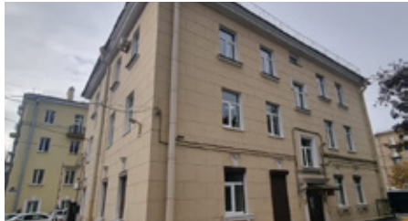
Комплексный центр социального обслуживания населения Кировского района