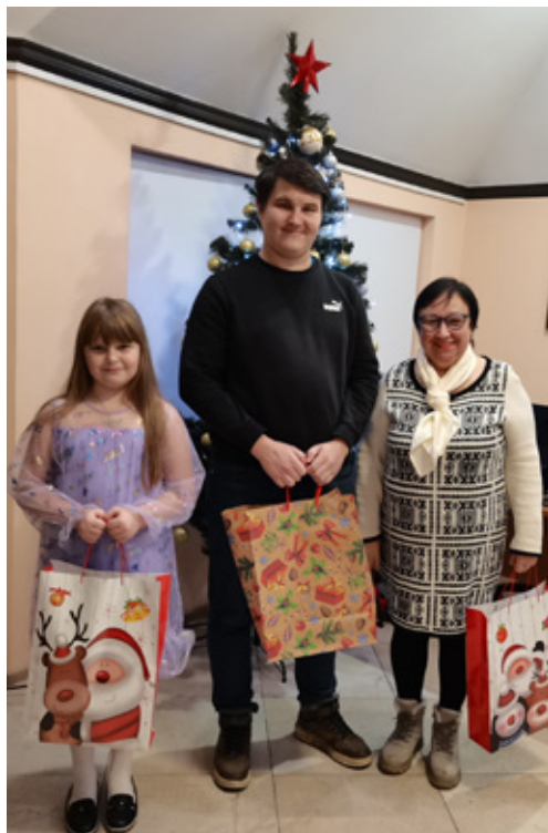
Победители конкурса «Сказочная зима»

Общественной приемной было организовано электронное голосование. Победителям вручены призы.