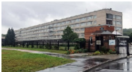
Психоневрологический интернат № 7 Красносельского района