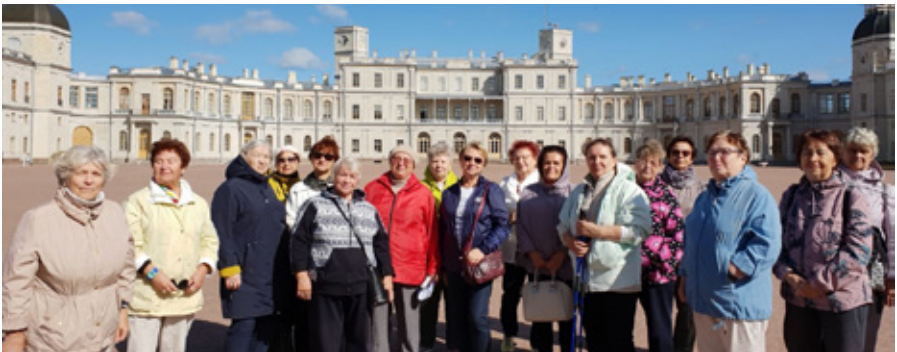
«Гатчина. Город трех императоров»