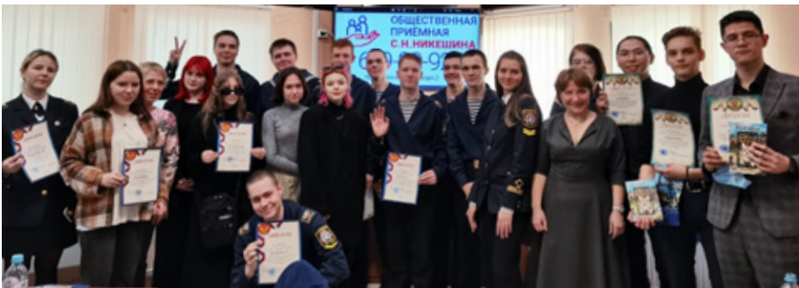
На интеллектуальном соревновании «Своя игра», посвященном 50-летию Красносельского района

Победители награждены дипломами и призами. Также всем участникам, кто не занял призовое место, вручены дипломы за участие в интеллектуальной игре.