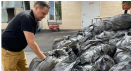
Психоневрологический интернат № 2 Петродворцового района