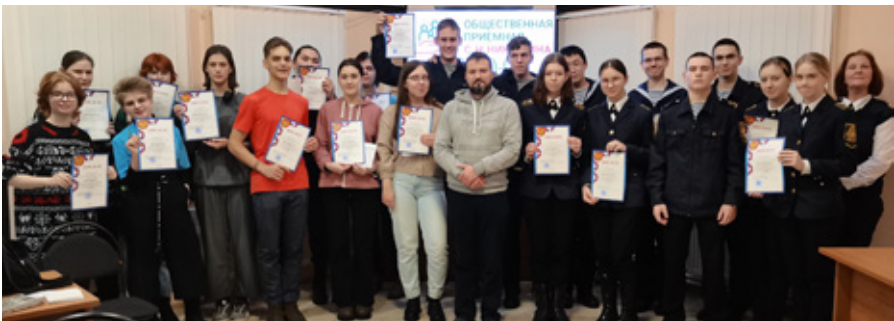
Участники интеллектуально-познавательной игры по литературе