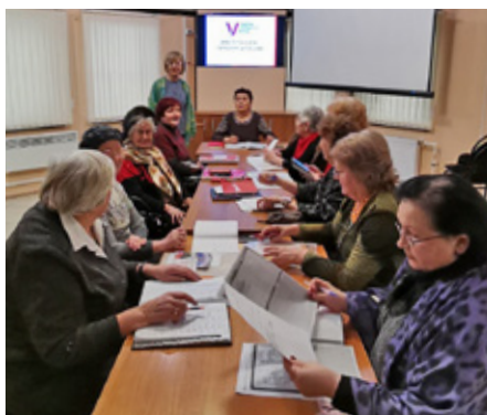
Встреча с активом общественных организаций Кировского и Красносельского районов