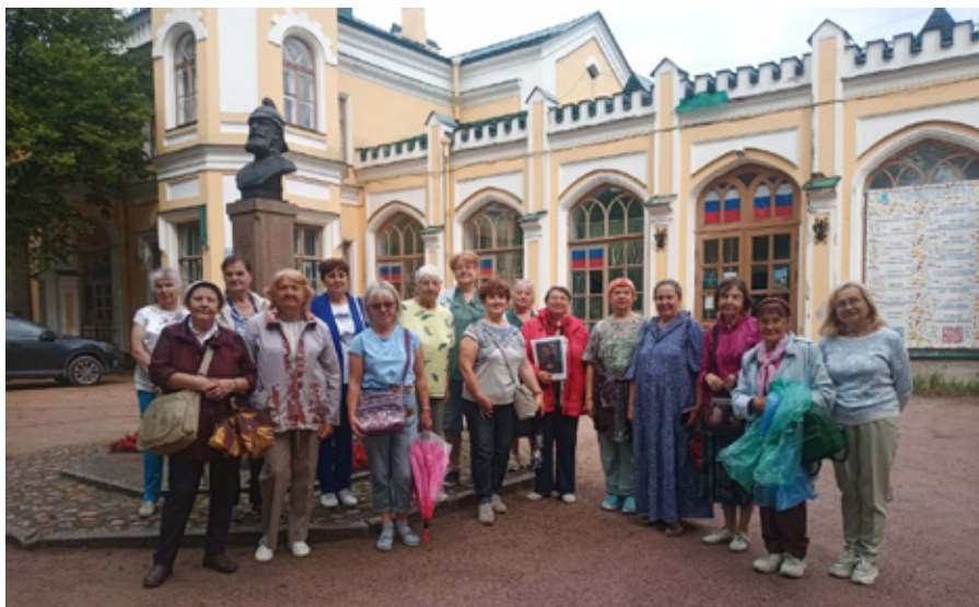
«Забутые усадьбы Петергофской дороги»