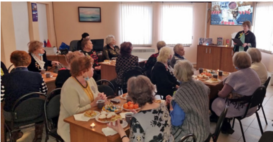
Мероприятие, посвященное 79-й годовщине освобождения Ленинграда от блокады