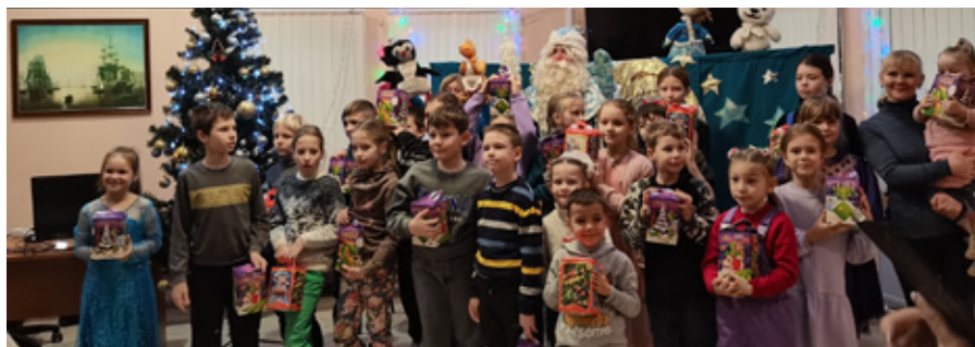
Новогоднее мероприятие для участников мастер-классов