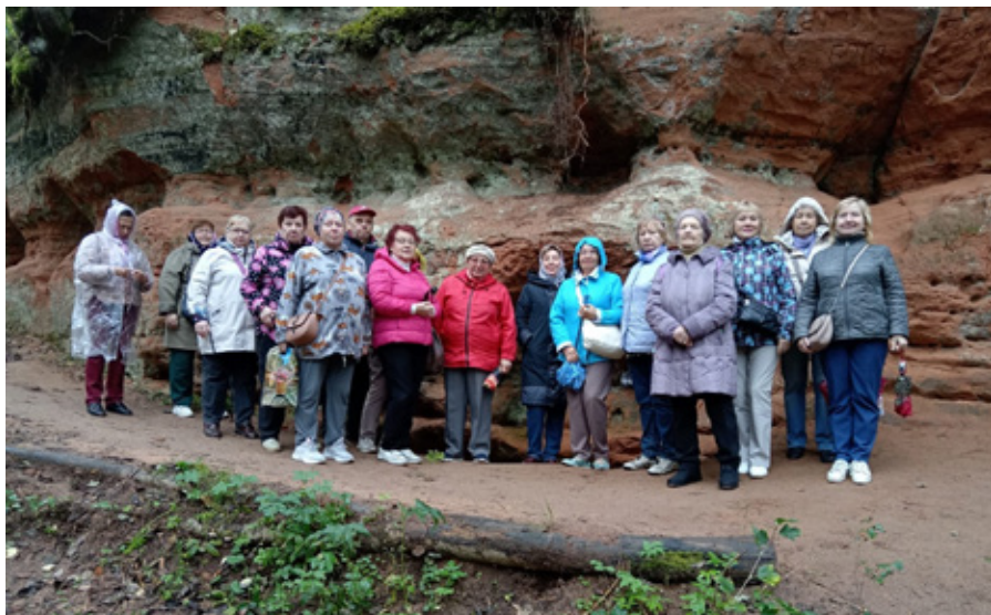
«Легендарные усадьбы Ленинградской области с посещением парка Рождествено»