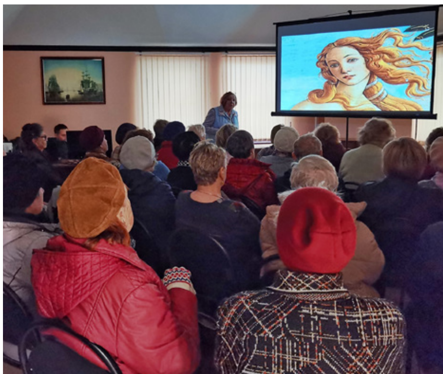
Лекция «Путешествие в мир прекрасного»

Видеозаписи лекций транслировались на нашей странице в социальной сети «ВКонтакте».