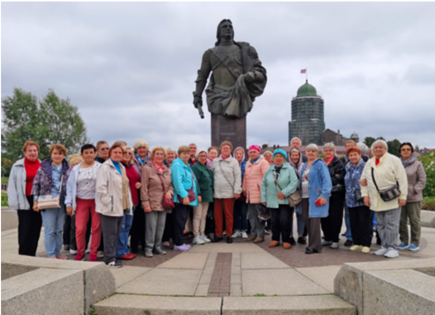
Экскурсия в Выборг