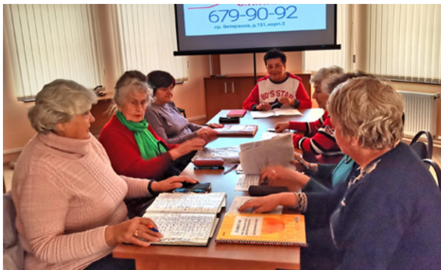
Заседание актива Совета ветеранов МО Сосновая Поляна

В помещении Общественной приемной ежемесячно во второй и четвертый четверг с 14 до 16 часов проводились приемы граждан Советами ветеранов № 1, 6, 7 МО Сосновая Поляна.