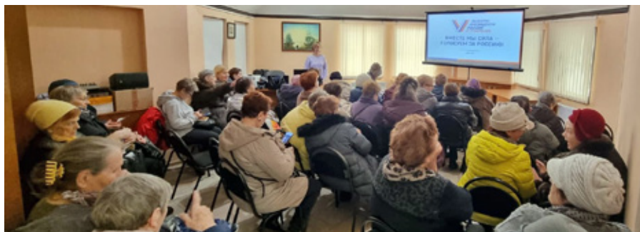
Встреча с жителями

■ В рамках избирательной кампании по выборам Президента РФ в Общественной приемной проходили встречи с жителями и активом общественных организаций с целью информирования о предстоящих выборах и необходимости участия в них.