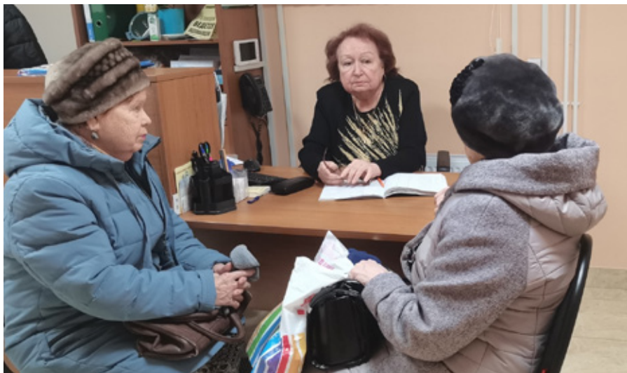
Бесплатная юридическая консультация