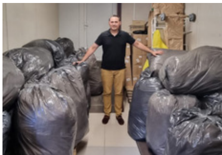
Городская больница № 26