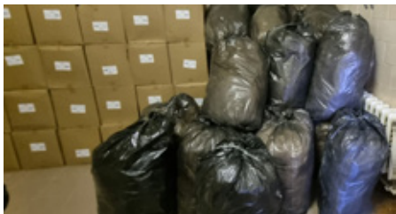
Психоневрологический интернат № 9 Красносельского района